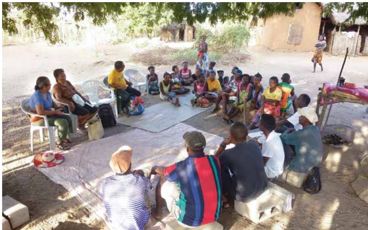
Un conseil de village à Madagascar.