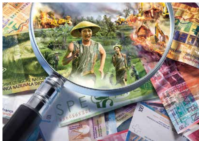
Affiche de la campagne œcuménique 2017 : les investissements sont la première cause d'accaparement des terres