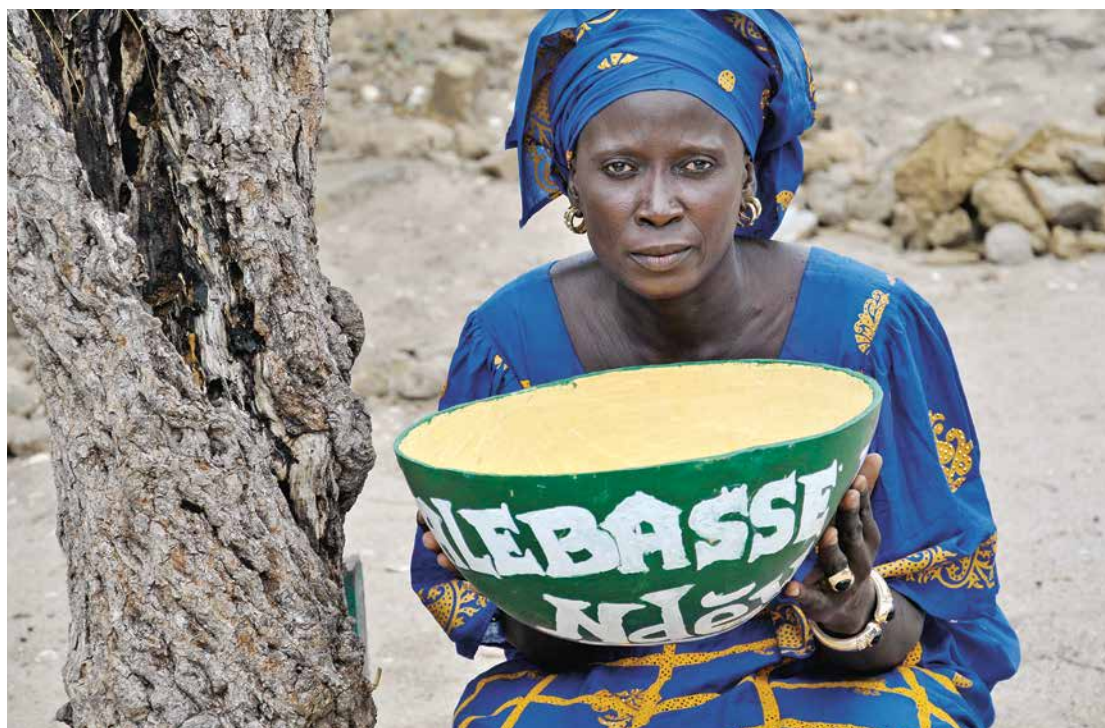
La calabasse est un récipient fabriqué à partir du fruit du calabassier. Aujourd'hui, le Sénégal compte presque 900 groupes de solidarité, répartis sur l'ensemble du territoire.

Manque de nourriture pendant la saison des pluies, soins de santé inabordables et impossibilité de s'affranchir de la spirale de l'endettement. Face à cette pauvreté et ses ravages, une solution existe : ce sont les Calebasses de solidarité.