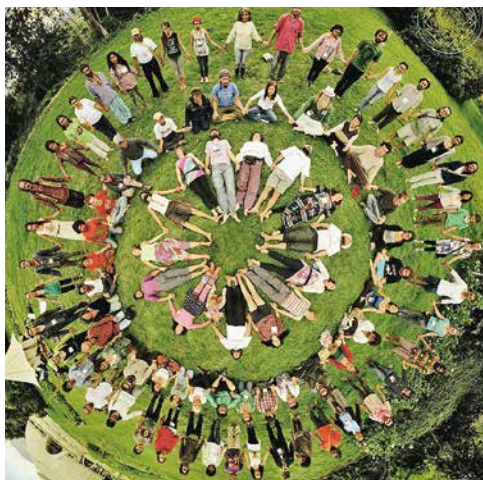
Formation en groupes, orientée vers l'expérience et la pratique

Les inscriptions sont ouvertes jusqu'au 29 mai 2018 à l'adresse : www.ppp.ch/transition . Aucun prérequis, sinon la motivation à participer activement à tout le