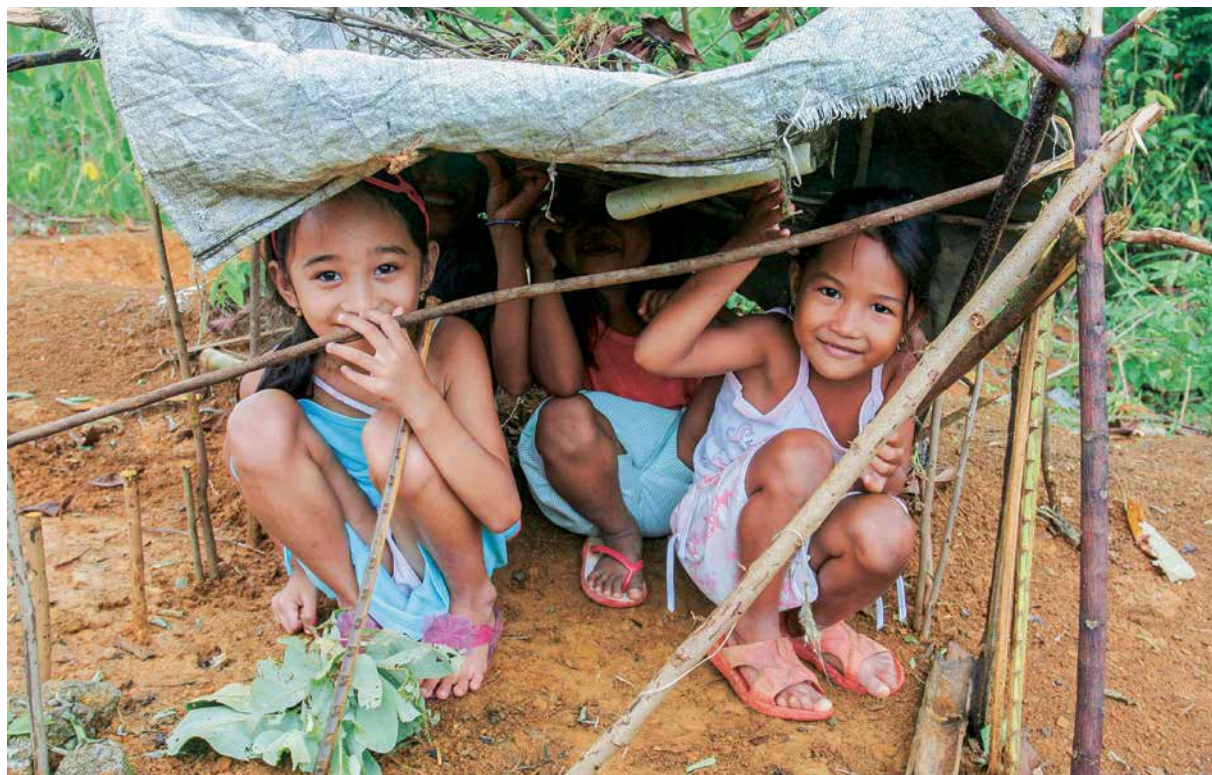
Dans la région côtière des Philippines près d'Infanta, de nombreux enfants vivent dans une pauvreté extrême.