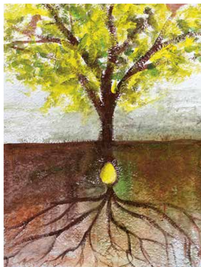
Oeuvre réalisée lors d'un précédent week-end d'écospiritualité