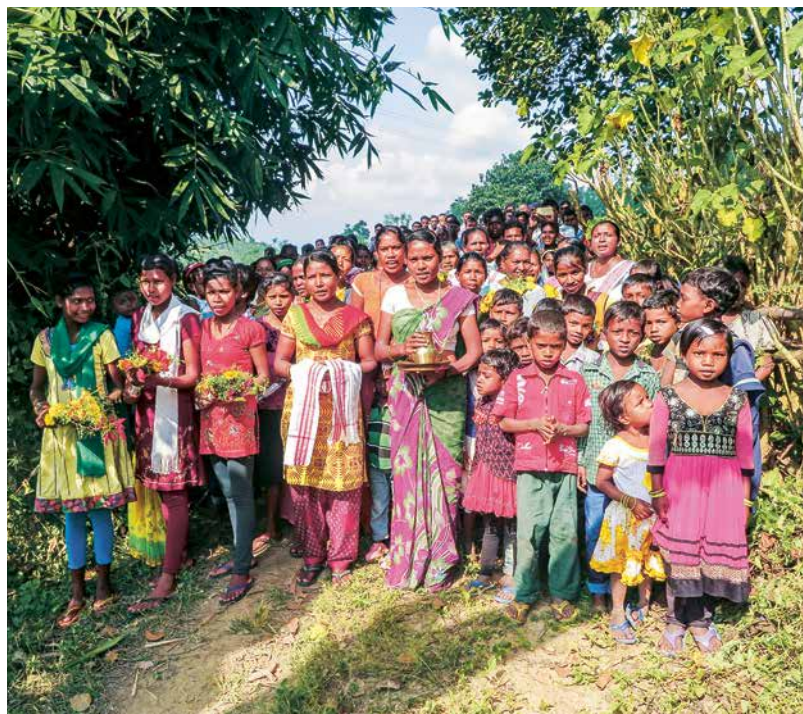
Les Adivasis du diocèse de Diphu, en Inde, ont appris à se mobiliser pour défendre ensemble leurs droits.

Toute mutation implique un processus à long terme dont la campagne œcuménique 2018 peut constituer une étape importante. Elle sera l'occasion, pour nous, non seulement d'esquisser des actions concrètes, mais aussi d'encourager à participer à ce processus.