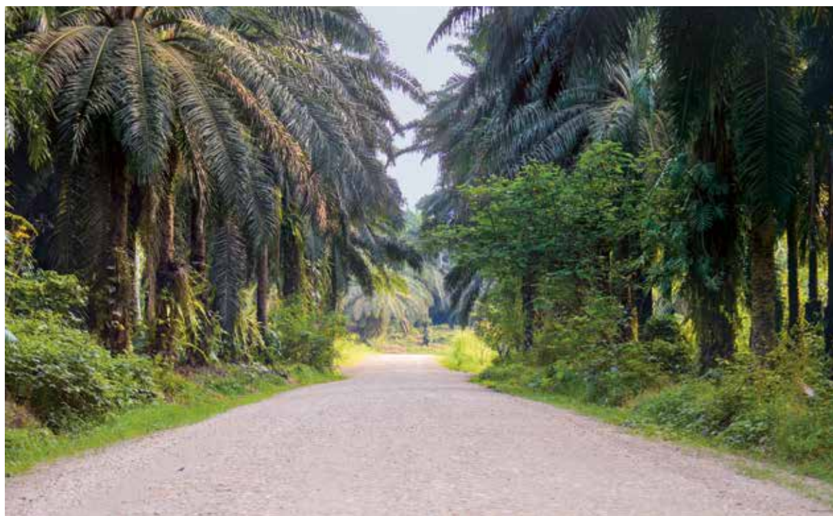
Les palmiers à huile ne laissent filtrer aucune lumière, si bien que les autres plantes ne peuvent plus pousser.