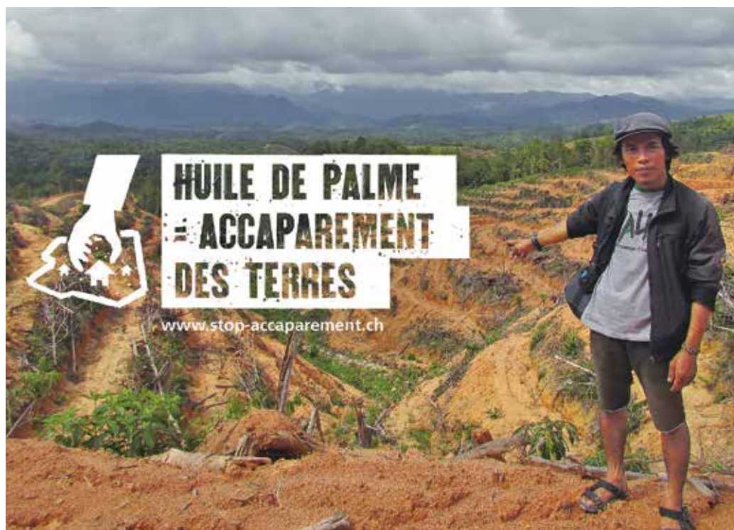
Le bilan humain et environnemental de l'exploitation d'huile de palme est épouvantable.