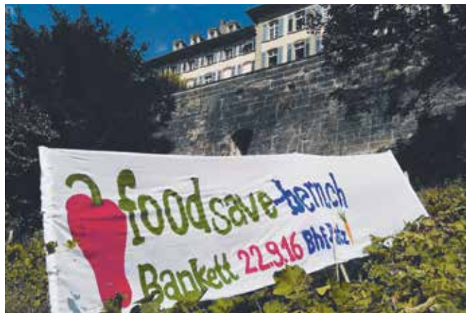
Stiftsgarten, un projet de jardin biologique et durable au cœur de la ville de Berne.

Environ un tiers des aliments produits en Suisse est perdu ou gaspillé le long de la chaîne alimentaire. Presque la moitié des déchets sont produits dans les ménages et la restauration: l'équivalent d'un repas complet par personne finit quotidienne-