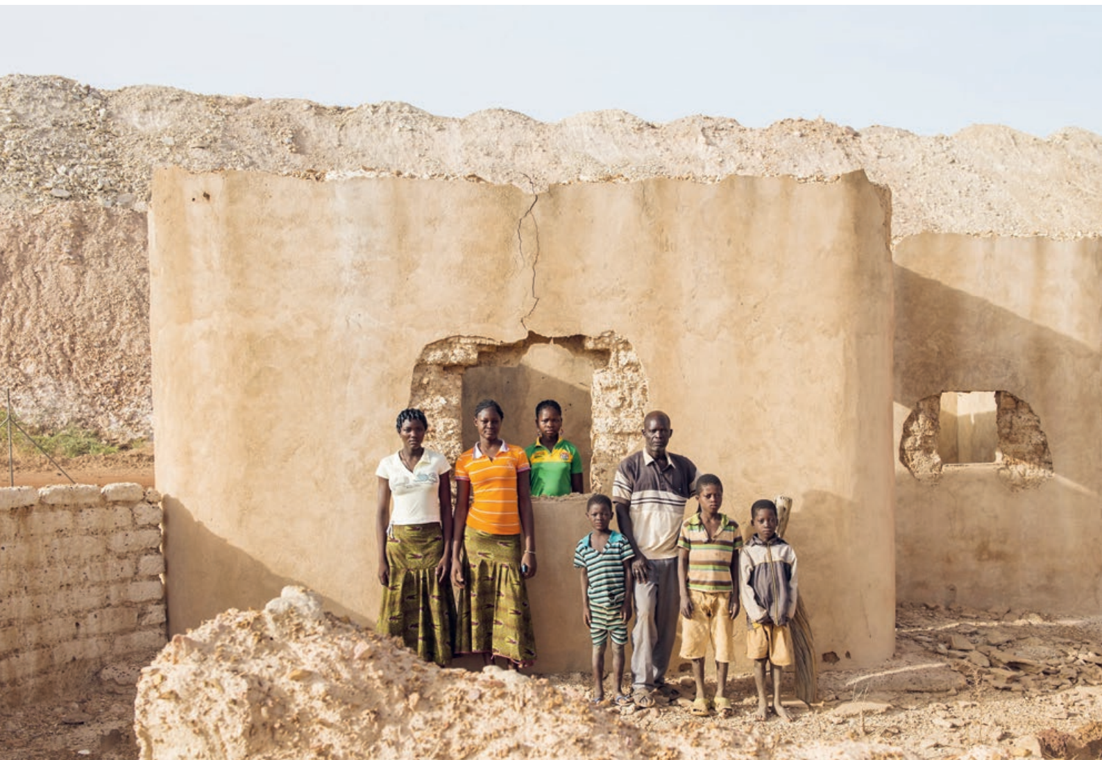
Au cours des douze dernières années, quinze grandes mines d'or ont vu le jour au Burkina Faso, déposédant de nombreuses familles de leurs terres.