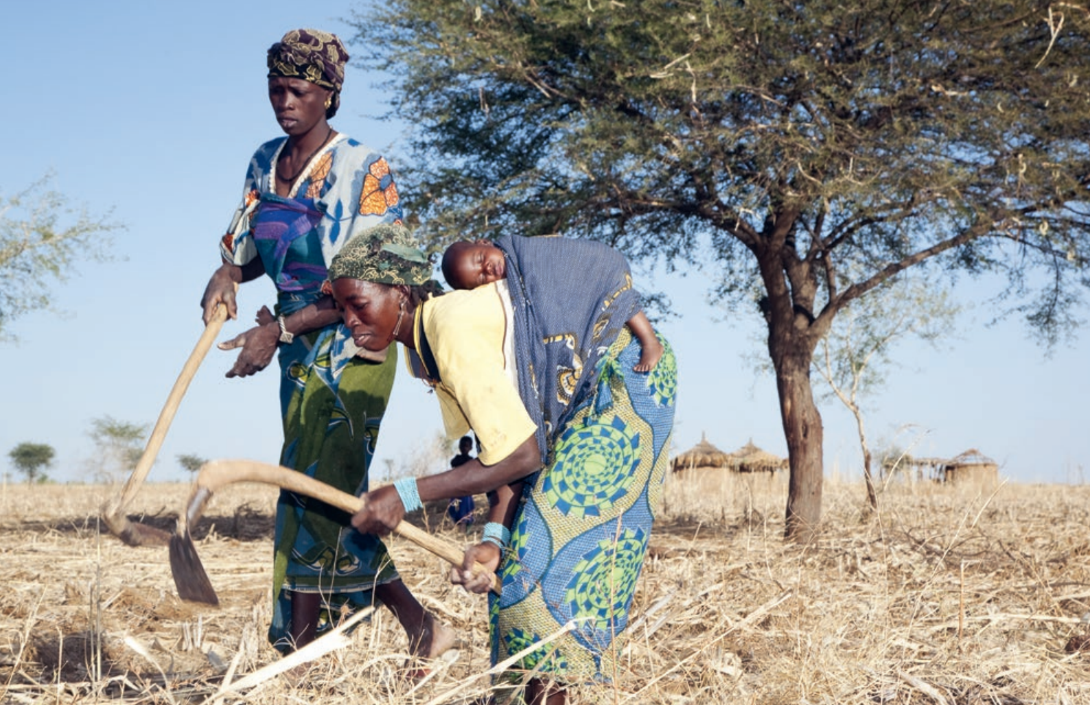
Au Burkina Faso, des femmes défrichent leurs champs pour éviter la prolifération des mauvaises herbes.