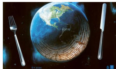
Płótno przedstawiające - Głód 2025/2026 „Wielka uczta”